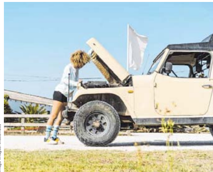
Autopanne: Die Versicherungen erhöhen wegen gestiegener Reparaturkosten ihre Prämien.

Die Finanzaufsicht Bafin mahnt die Branche seit Monaten, die Preise für Autoversicherungen zu erhöhen. Die Versicherer hätten „teils zu optimistische Annahmen“ über die Höhe der zukünftigen Schadeninflation getroffen. In einer Mitteilung an die Versicherungswirtschaft fordern die Aufseher ungewohnt deutlich Preiserhöhungen: „Dauerhaft defizitäre Versicherungszweige sind nicht akzeptabel.“